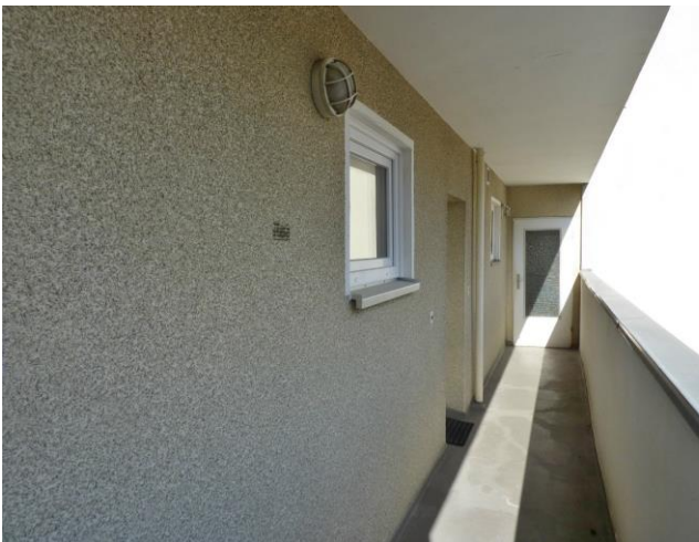
Zugang zur Wohnung