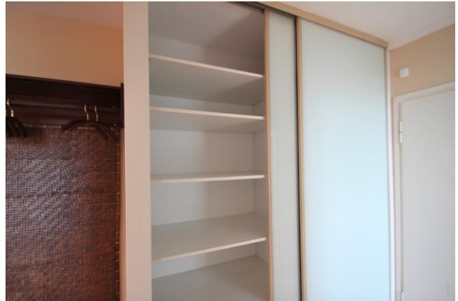
Einbauschränk im Flur