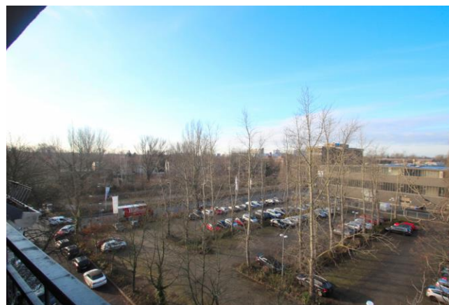
Blick vom Balkon