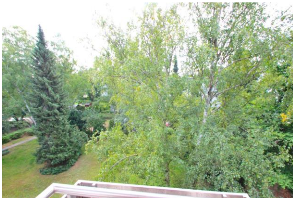
Blick aus dem Fenster